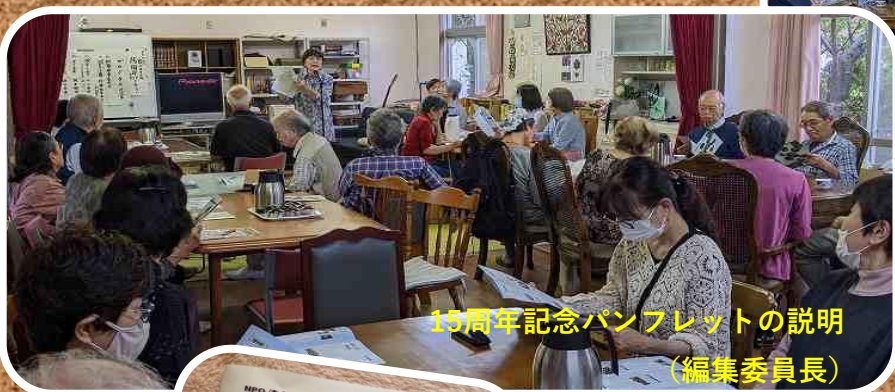
15周年記念パンフレットの説明 (編集委員長)