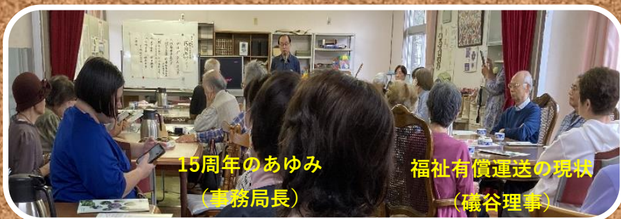
15周年のあゆみ (事務局長)