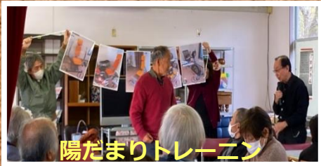
陽だまりトレーニン

陽だまり忘年会 2024年12月13日 こもれびにて 参加者 54名 各サークルの活動報告がありました。