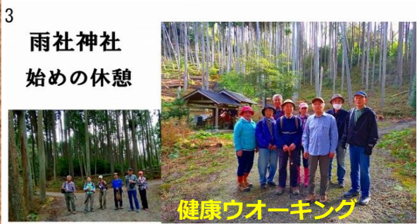
健康ウォーキング