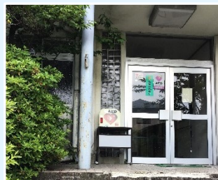
比叡平・陽だまりの会本部 (環境と福祉の家)